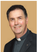
Ángel Fernández Artime

El monumento dedicado a Don Bosco delante de la Basílica de María Auxiliadora en Valdocco es un símbolo de la misión de los salesianos en el mundo.