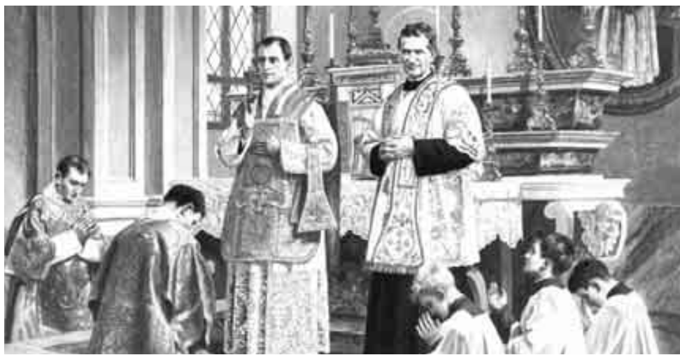
IMAGEN DE la primera misa que celebró Miguel Rúa. Sin solemnidad especial fue asistido por Don Bosco. En ella, Don Rúa dio las gracias a todos, y les pidió que rogasen al Señor por él para que pudiera vivir como digno sacerdote.

» El beato murió la mañana del 6 de abril de 1910. Fue el primer sucesor de Don Bosco